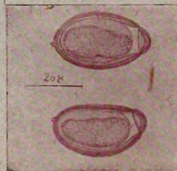
Рис. 3. Яйца S. ovis

Редколлегия: Я. И. Соломенцев (отв. редактор) С. П. Голубев, Ф. А. Хейфиц