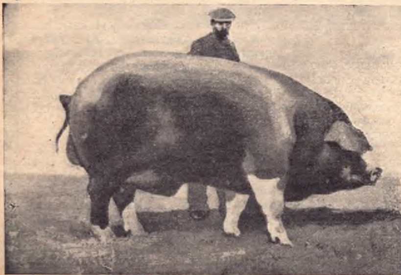
ВОТ ТАКИХ СВИНЕЙ ВЫРАЩИВАЮТ АМЕРИКАНСКИЕ ФЕРМЕРЫ

Первым препятствием, встречающимся на пути организации контрольной работы, является недостаток соответствующим образом подготовленных кадров. Проведение точных записей, учета поросят и взвешивания, ведение всех остальных контрольных наблюдений и записей могут быть осуществлены только хорошо