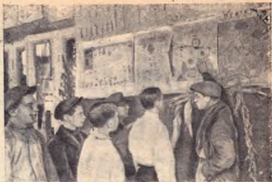
МОЛОДЕЖЬ ГОТОВИТ КАДРЫ. ЗАНЯТИЯ В БАТРАЦКОМ УНИВЕРСИТЕТЕ СОВХОЗА «ХУТОРОК»

Не имея возможности привести в этой статье цифровой материал, характеризующий достижения контрольной работы, мы