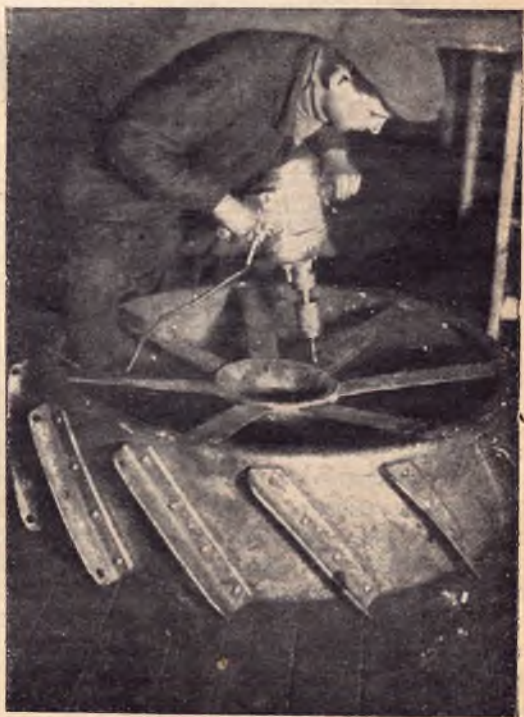
КОМСОМОЛЕЦ УДАРНИК ЗА СВЕРЛОВКОЙ ОТВЕРСТИЯ ДЛЯ ПРИКРЕПЛЕНИЯ ТРАНТОРНОГО КОЛЕСА

Один из способов подготовки — проектируемая организация вечерних школ колхозной молодежи. В колхозах, в которых будут свиноводческие фермы, вечерними школами колхозной молодежи