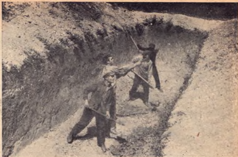
КОМСОМОЛЬЦЫ - УДАРНИКИ НА РАБОТЕ ПО ВЫКОПКЕ СИЛОСНОЙ ЯМЫ

все работники-комсомольцы. Такие курсы можно организовать в наиболее населенных пунктах и даже в отдельных колхозах. Колхозы могут организовать курсы, пригласив для этого зоотехника. В крайнем случае зоотехник может наладить курсы и не работая в качестве руководителя, а только наблюдая за учебой. Это даст возможность колхозу обойтись без обременительного в материальном отношении штата. Наиболее способных и интересующихся делом работников можно затем направлять на курсы повышения квалификации, выпускающие квалифицированных свинотехников, являющихся основной зоотехнической фигурой в «низовке», опорой колхозного свиноводства. Наконец комсомольцы сами должны явиться застрельщиками организации вечерних школ крестьянской молодежи со свиноводческим уклоном, должны не только учиться в них, но и привлекать в них своих товарищей, способствуя этим подготовке санитаров, старших и младших свинаярей и др.