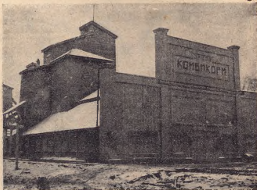
ЗАВОД ПО ИЗГОТОВЛЕНИЮ КОМБИКОРМА ДЛЯ С.-Х. ЖИВОТНЫХ В СОВХОЗЕ „ЛЕСНЫЕ ПОЛЯНЫ“

ЗА КРУПНОЕ МЕХАНИЗИРОВАННОЕ ОБЩЕСТВЕННОЕ ЖИВОТНОВОДЧЕСКОЕ ХОЗЯЙСТВО