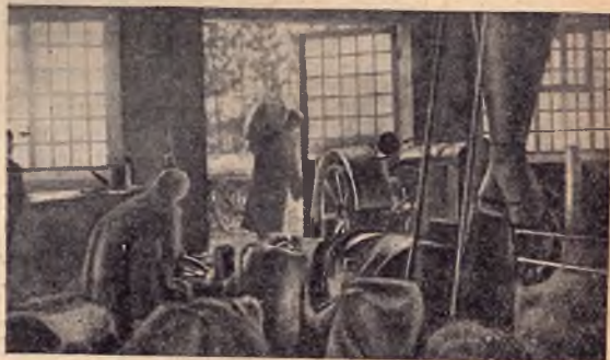
Уборка готовой продукции после работы на «Близзарде».