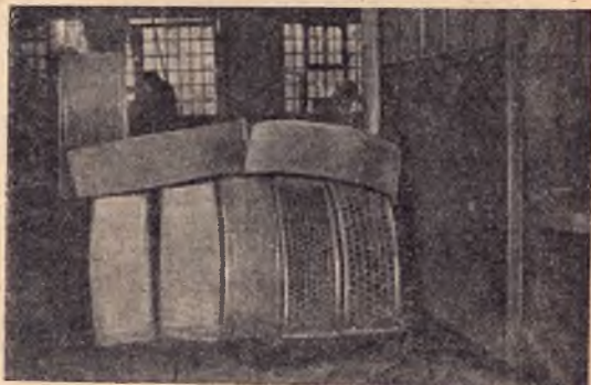
Сита для дробления к машине «Близзард».