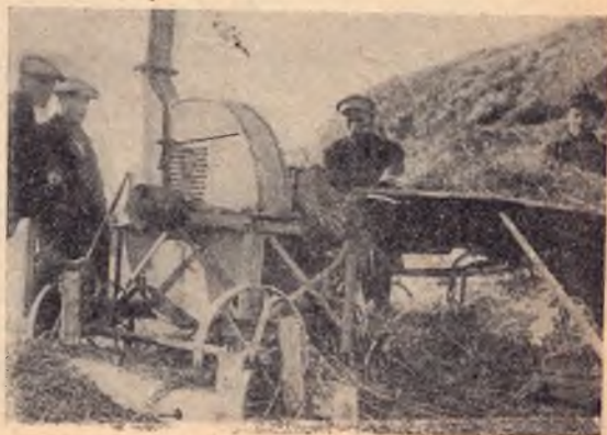
Корморезка в совхозе Иман ер.