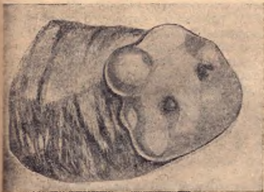
Свежие пузырьки на пятке у свиньи при ящуре

При заболевании свиней ящуром также возможно заражение людей. У человека эта болезнь выражается главным образом в за-