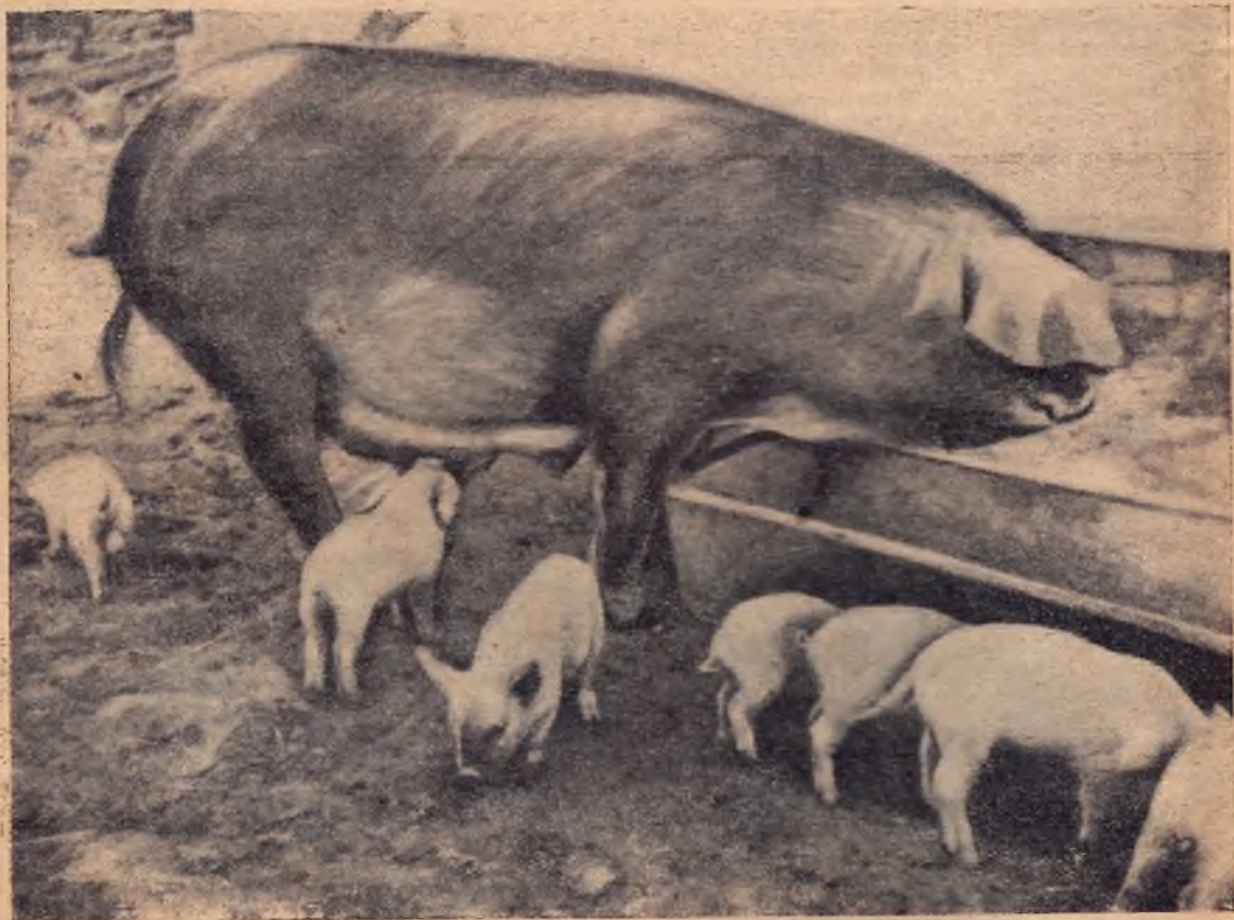
Зуевская артель «Исира» (ЦЧО). Матка с поросятами у кормушки