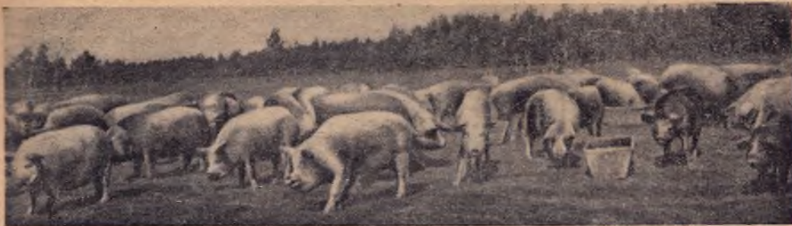
Ферма «Столарпром» (ст. Химни, Мох. обл.) Стадо племенных английских маток

действуют на основании особого договора, заключаемого колхозом с Свиноводколхозцентром. На основании этого договора колхоз обязуется выделить все общественное поголовье свиней в обособленную отрасль и вести хозяйствование с этим стадом по производственному плану, утвержденному Свиноводколхозцентром. Колхоз обязуется договором организовать необходимую для свиноводческой фермы кормовую базу, обеспечить ферму рабочей и тяговой силой и хозяйственными постройками, комплектовать свиное стадо в соответствии с планом, утвержденным Свиноводколхозцентром, и предоставлять Свиноводколхозцентру ежегодно всю товарную продукцию. Со своей стороны Свиноводколхозцентр берет на себя кредитование свиноводческой фермы, снабжение ее сильными кормами, племенными производителями, оказывает ферме инструкторскую, агрозоотехническую и ветеринарную помощь, организует сбыт продукции фермы и подготовку квалифицированных работников и специалистов для фермы. В 1931 г. на организацию свиноводческих товарных ферм правительством отпущено 43 млн. руб., из них 32 млн. руб.— на постройку свинарников и 11 млн. руб.— на покупку свиней. Кредитование колхозов (по линии свиноводческих ферм) организуется с таким расчетом, что на строительство свинарников выдается кредит в размере 40% стоимости сооружений, а на покупку свиней — в размере 60% стоимости купленных на ферму свиней. Остальная часть сумм выделяется колхозом из собственных средств.