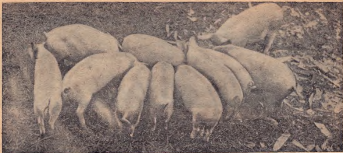
Коммуна «Красный Октябрь» (Калужский район Мос. обл.). Свины морширской породы откормочного пункта

с общим поголовьем в 375,6 тыс. голов. К концу 1931 г. картина развертывания колхозных свиноводческих товарных ферм будет представляться в следующем виде: