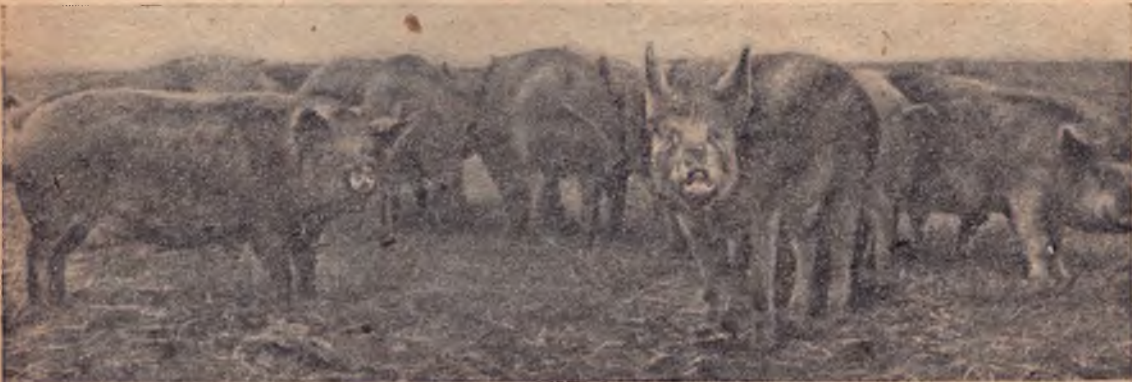
Колхозница «Звезды Ильича» (АСХР немцев Поволжья). Свиньи на прогулке

«Ни один германский свиновод не должен весной текущего года подвергать случке большее количество маток, чем в прошлом году. Тот, кто не соблюдает указанной меры предосторожности, должен помнить, что он сам яв-