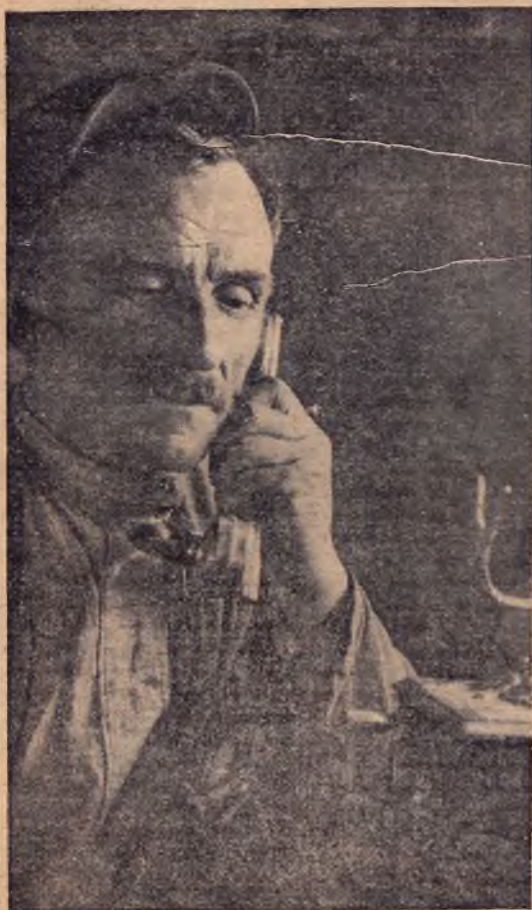
Плехоз «Венцы-Заря» (Северный Кавказ). Все свинарники объединены телефоном с ветпунктом. Старший свинарь вызывает ветеринара.

Разрешение свиноводческой проблемы не ограничивается организацией гигантов-совхозов по линии Свиноводтреста. Значительная часть задачи по разгону свиноводства возлагается, при участии совхозной системы, на колхозы. В этих целях по инициативе самих колхозников при колхозах образуют специальные товарные свиноводческие фермы (СТКФ), которые, будучи неразрывной частью колхоза,