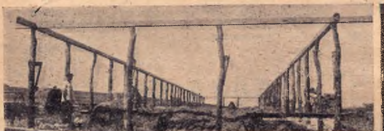
Совхоз № 22 (Сев. Кавказ). Строящийся свинарник для опороса маток свинарник, почти отстроенный

Проявляйте инициативу! По-большевистски деритесь за каждую постройку, за каждое теплое свиноместо на зиму!